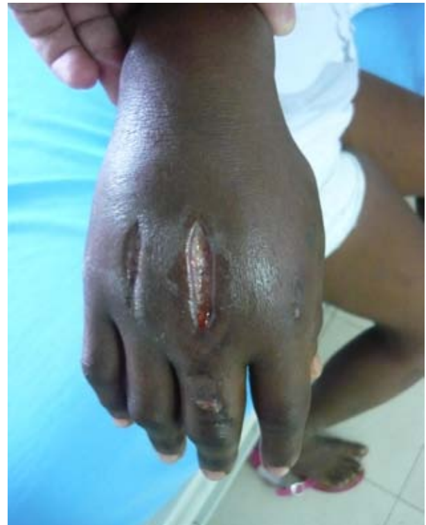
Figura N° 1. Mordedura humana de espesor total. Edema severo del espesor total de la mano y la limitación funcional

Si el paciente presenta signos de infección, cuadro hemático, PCR y VSG deben ser solicitados. Es de utilidad tomar muestras para cultivo y antibiograma (1). Como las infecciones son polibacterianas y en consideración al tipo de metabolismo de las bacterias inmiscuidas, se requieren cultivos especiales con mayor tiempo al habitual para establecer el crecimiento de las colonias.